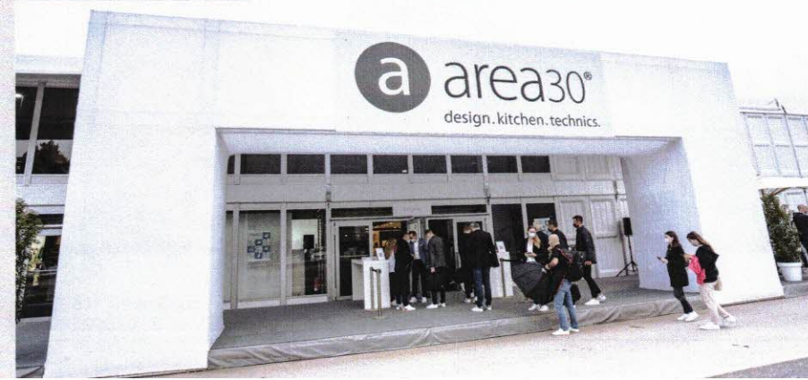
„Mehr Aussteller, mehr Fläche und mehr Produktgruppen“: Die area30 in Löhne setzt neue Bestmarken