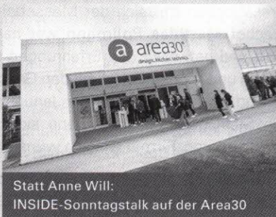
Statt Anne Will: INSIDE-Sonntagstalk auf der Area30

Zusammen mit Trendfairs organisieren wir im Messeherbst auf der Area30 erstmals einen INSIDE-Talk zu alten und guten sowie neuen und frischen Ideen im Küchenmarkt.