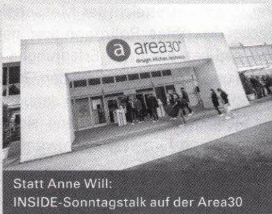
Statt Anne Will: INSIDE-Sonntagstalk auf der Area30

Zusammen mit Trendfairs organisieren wir im Messeherbst auf der Area30 erstmals einen INSIDE-Talk zu alten und guten sowie neuen und frischen Ideen im Küchenmarkt.