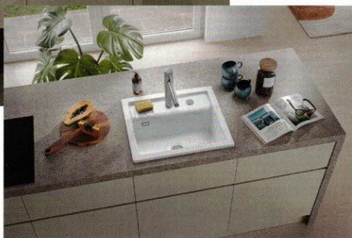
Ein Schelm, wer bei dieser neuen Spüle aus der Contura Kollektion von Naber an Systemceram und Hans Winkler Design denkt.

Innovation und Design stehen im Mittelpunkt des diesjährigen Messeauftritts von Quooker . Präsentiert wird der neue Flex Square, eine kantige Ergänzung der erfolgreichen Flex-Serie. Mit Ausziehschlauch, klarer Linienführung und bewährter Funktionalität verbindet er moderne Optik mit Alltagstauglichkeit – von 100 °C kochendem Wasser auf Knopfdruck bis hin zu gekühltem, sprudelndem oder stillem Wasser mit dem optionalen Cube. Für Inspiration und Unterhaltung sorgen zudem Live-Acts: Showkoch Dominik Wetzel zeigt kreative Gerichte mit Quooker, während ein Mixologist erfrischende Drinks inszeniert. Damit vereint der Messeauftritt technische Innovation mit kulinarischem Erlebnis und setzt ein starkes Statement für modernes Küchendesign.