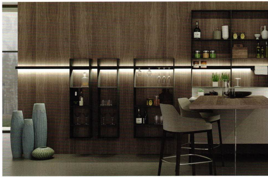
Wenn es um Licht geht, setzt Naber immer wieder Akzente, hier mit dem neuen beleuchteten Relingsystem Accomoda Lucento in Schwarz.

Naber zeigt auf der area30 zahlreiche Neuheiten. Highlight ist die Premiere einer neuen Spülenfamilie in Keramik, Edelstahl und Composite. Ergänzend erweitern acht neue